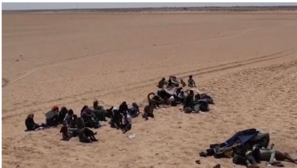
Geflohene Personen in der tunesischen Wüste