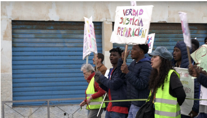
Demonstration in Ceuta on 6 February 2024.

1 October - 31 March 2024 - Children on the Move