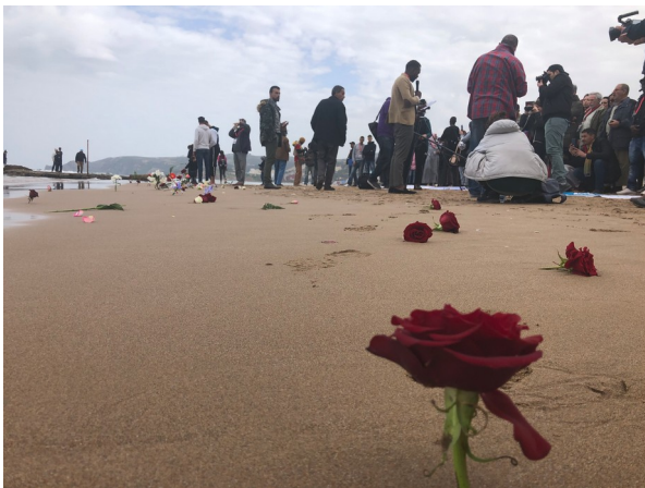
CommemorAction 2020 near Oujda

The 4 days will be an opportunity for families from different African countries to meet, exchange their experiences and come together united against the forced disappearance of their loved ones.